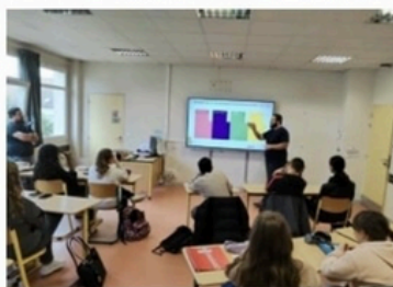
Intervention de l'Association des Berger d'Île de France et de Interbev - Filière viande