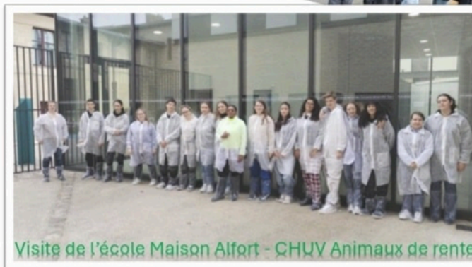
Visite de l'école Maison Alfort - CHUV Animaux de rente

Entre septembre et octobre, les apprenants ont multiplié les expériences de terrain : manipulation des ovins avec les CGEA, visite d'une exploitation ovine label rouge, et intervention des Bergers d'Île-de-France et d'INTERBEV pour approfondir leurs connaissances du secteur. De belles découvertes et de nouveaux apprentissages pour tous !