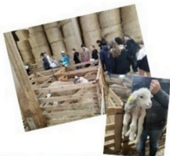
Visite d'une exploitation à Lizines 77